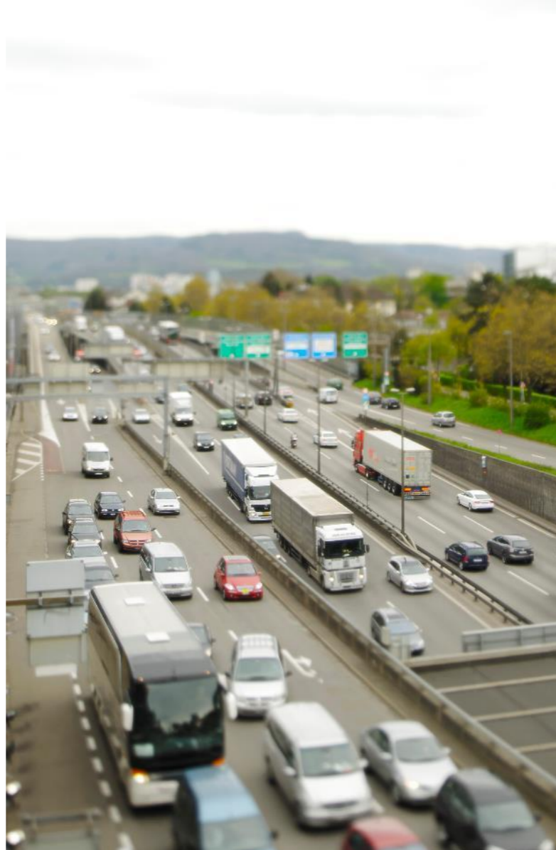
Trinationale Strategie Strasse